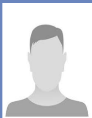
LOUVARD Guy Chargé d'expertise crédit 72