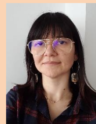
VALLEE Eve CC Laval Cathédrale 53